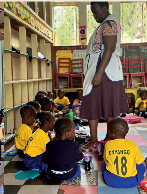
SKOLE I UGANDA