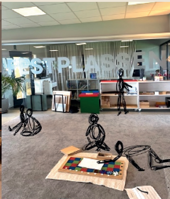
DA VINCI MONTESSORISKOLE