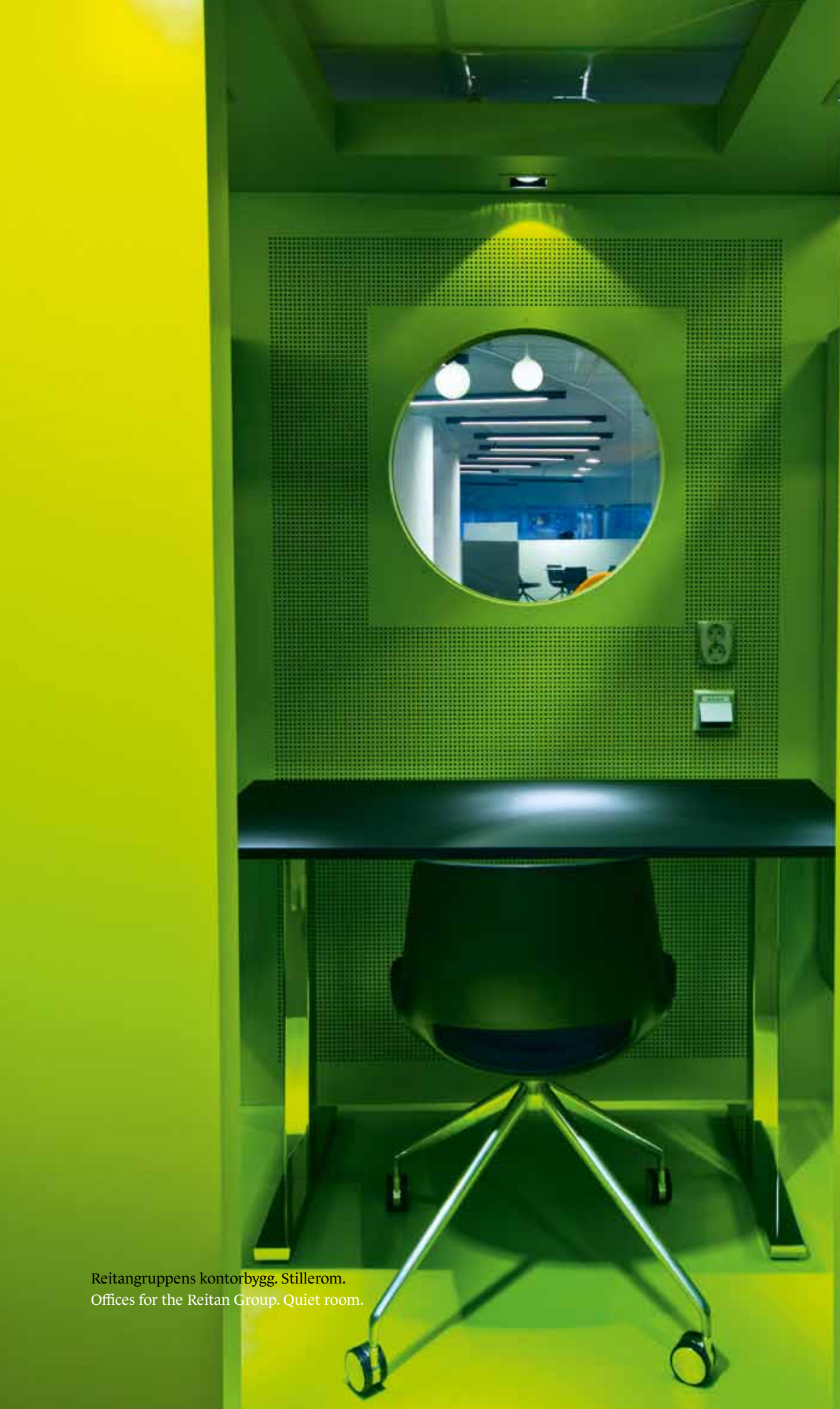
Reitangruppens kontorbygg. Stillerom. Offices for the Reitan Group. Quiet room.