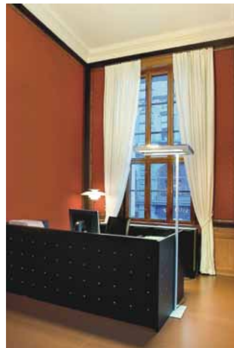
Urbygningen, Universitetet i Oslo. Kontor. Domus Academica, the University of Oslo. Office.