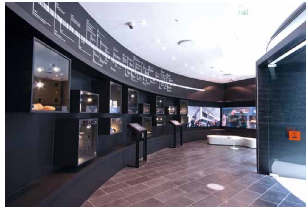
Reitangruppens kontorbygg. Museum. Offices for the Reitan Group. Museum.