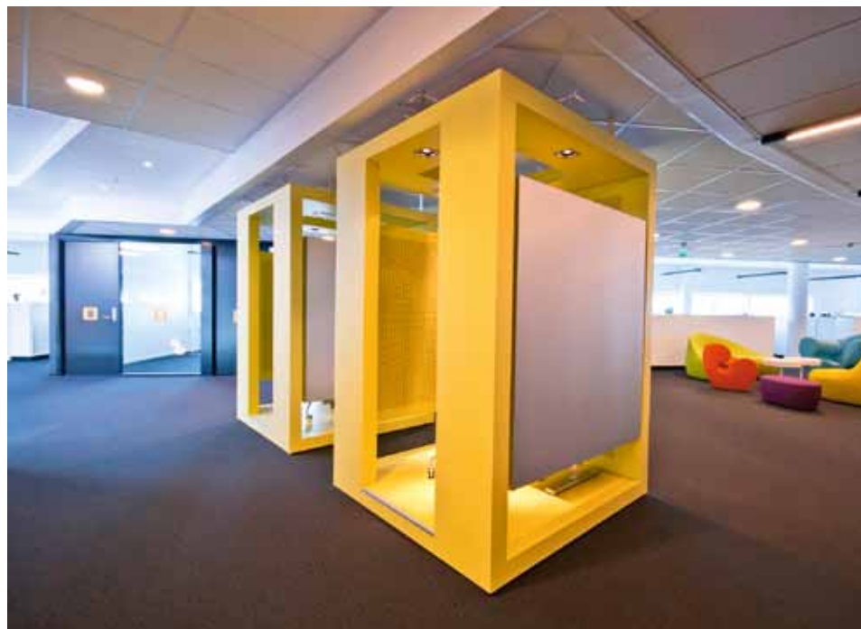
Reitangruppens kontorbygg. Kontorareal med stillebokser og pauseplass. Offices for the Reitan Group. Open plan office with quiet boxes and informal seating.