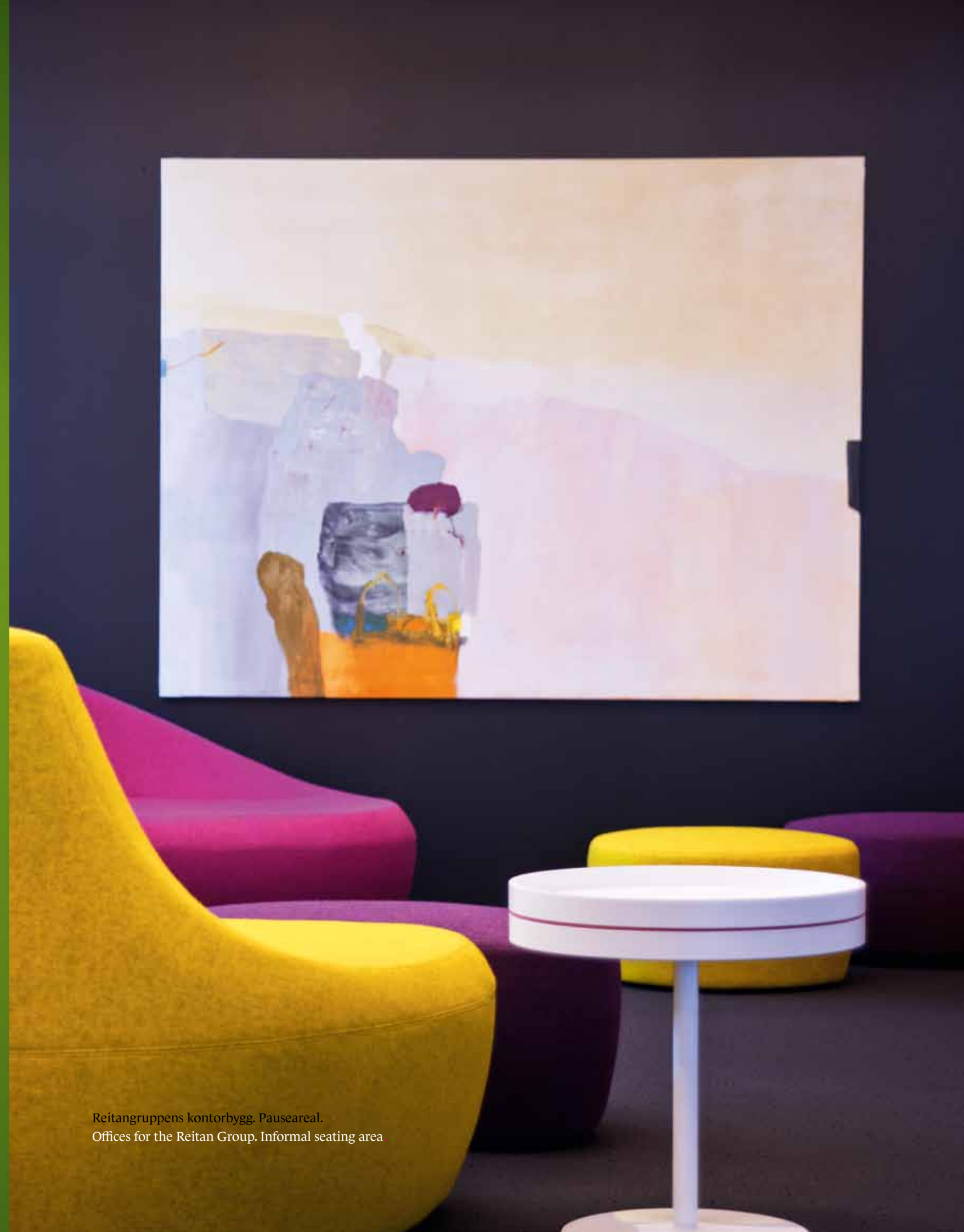
Reitangruppens kontorbygg. Pauseareal. Offices for the Reitan Group. Informal seating area.