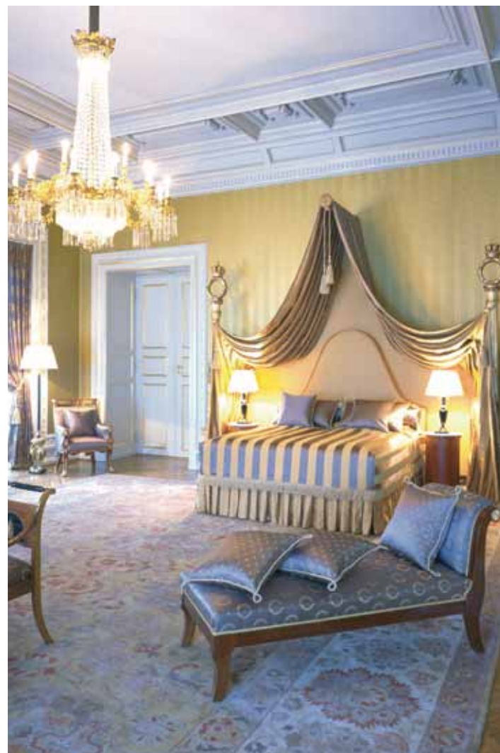
Ominnredningen av det kongelige slott. Fyrstesonen, Kong Haakon's suite. The refurbishment of the Royal Palace, Oslo. King Haakon's Suite.