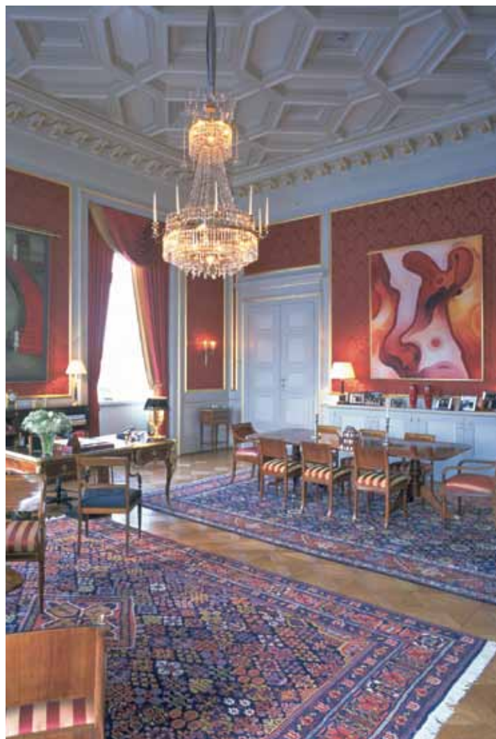
Ominnredningen av det kongelige slott. HM Dronningens audiensværelse. The refurbishment of the Royal Palace, Oslo. HM the Queen's audience chamber.