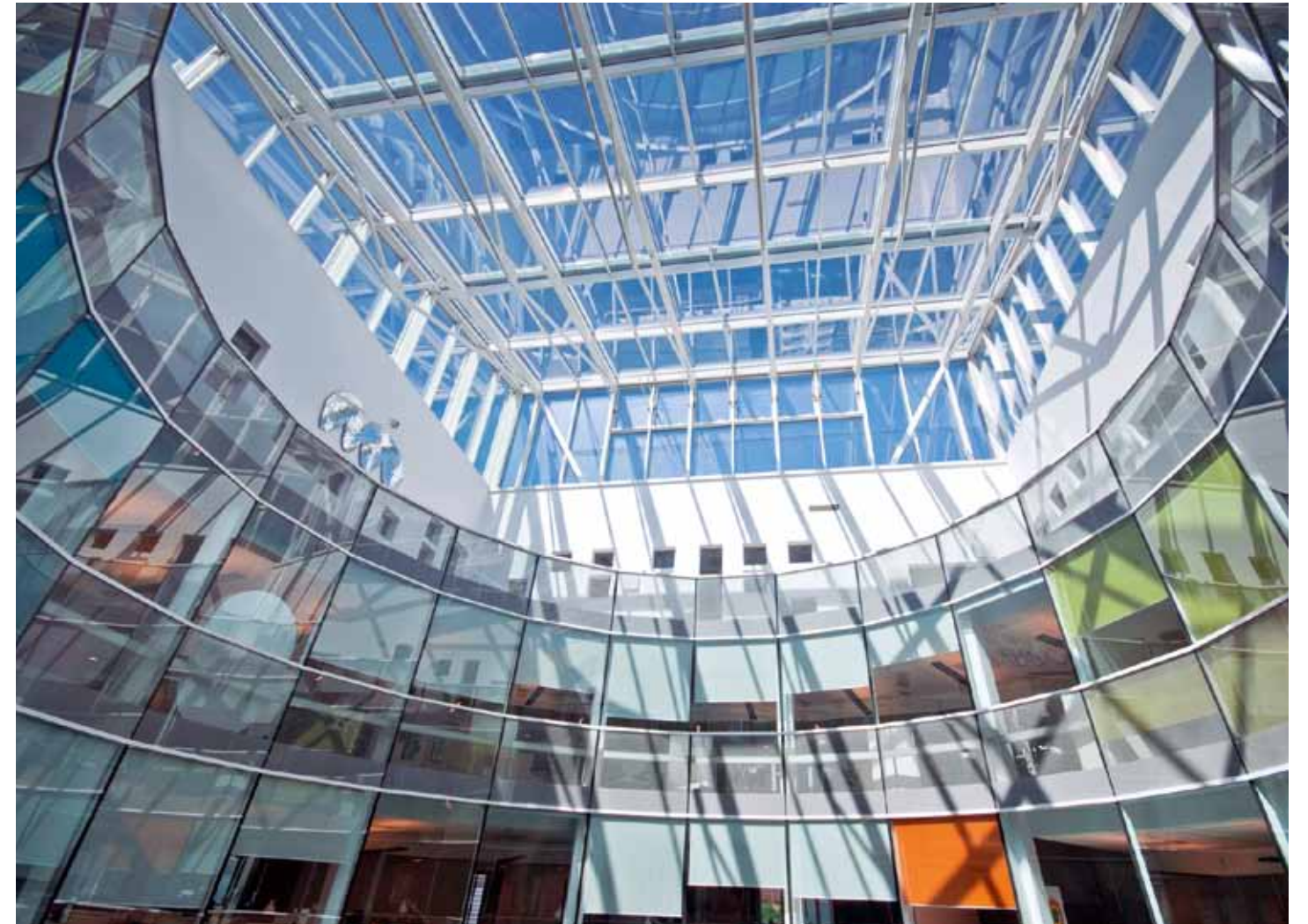
Innredningen av Reitangruppens kontorbygg i Gladengveien på Ensjø startet høsten 2006. Fra lysgården. The interior fitout of the offices for the Reitan Group in Oslo started in the autumn of 2006. From the atrium.

På hvilken måte jeg velger å tilføre eller eventuelt unnlate bruk av farger avhenger av prosjektet.