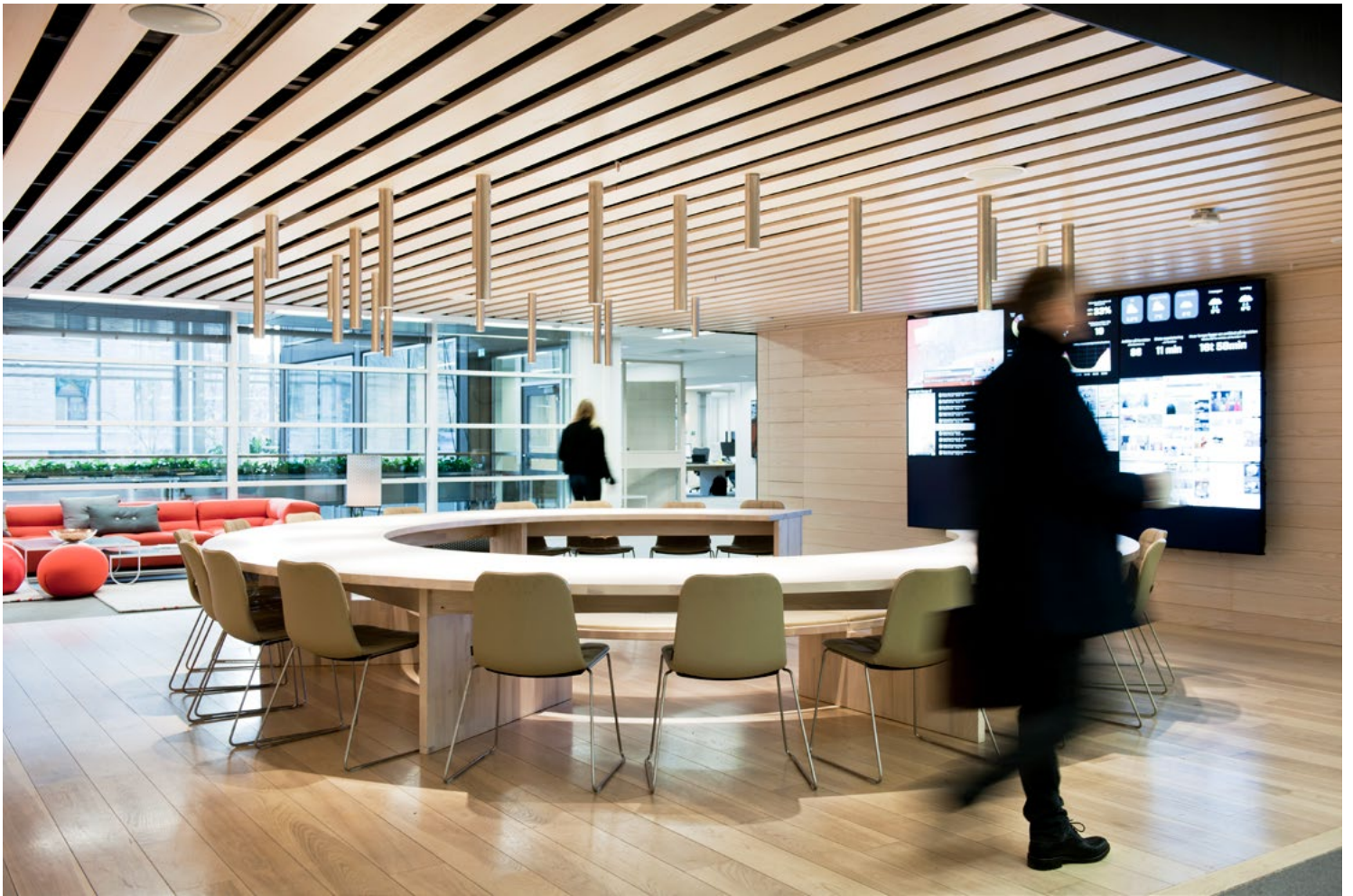
AFTENPOSTEN → OSLO → 2014 Samlingssted for morgenmøte/briefing. IARK AS Prosjektleder → Heidi Tolo, interiorarkitekt MNIL