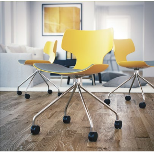
BONE CHAIR → 2014 LARS TORNØE DESIGN/ATLE TVEIT DESIGN/ STEINAR HINDENES DESIGN AS Prosjektledere → Lars Tornøe, Atle Tveit, Steinar Hindenes, møbeldesignere MNIL