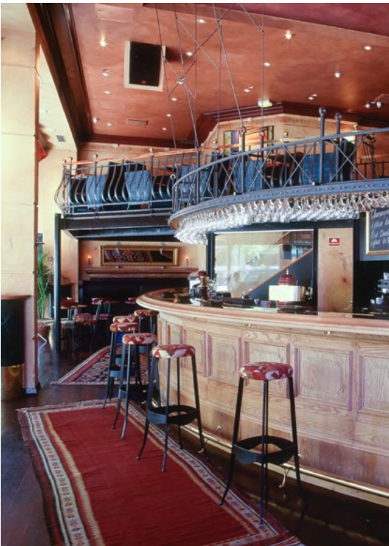
LIPP→OSLO RISS AS Petter Abrahamson, interiørarkitekt MNIL