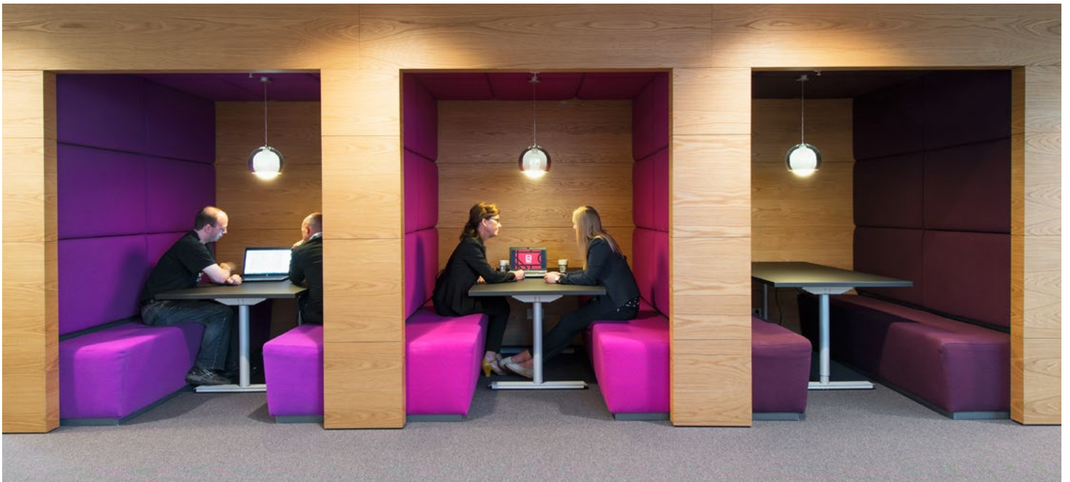
EIDSIVA BREDBÅND AS → REHABILITERING AV KONTORLOKALER → LILLEHAMMER → 2014 ASPLAN VIAK AS Prosjektleder → Annetin Hurum, interiorarkitekt MNIL