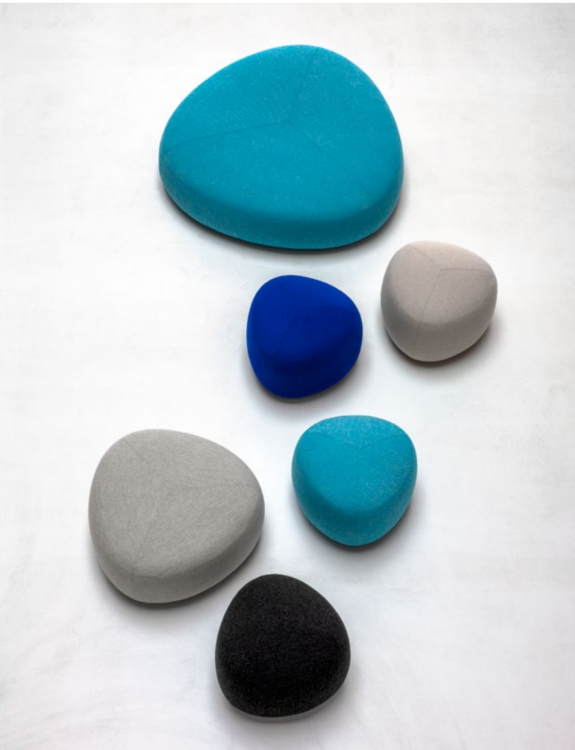
KIPU FOR LAPALMA → PUFF → 2014 ANDERSSEN & VOLL Prosjektleder → Espen Voll, møbeldesigner og interiørarkitekt MNIL