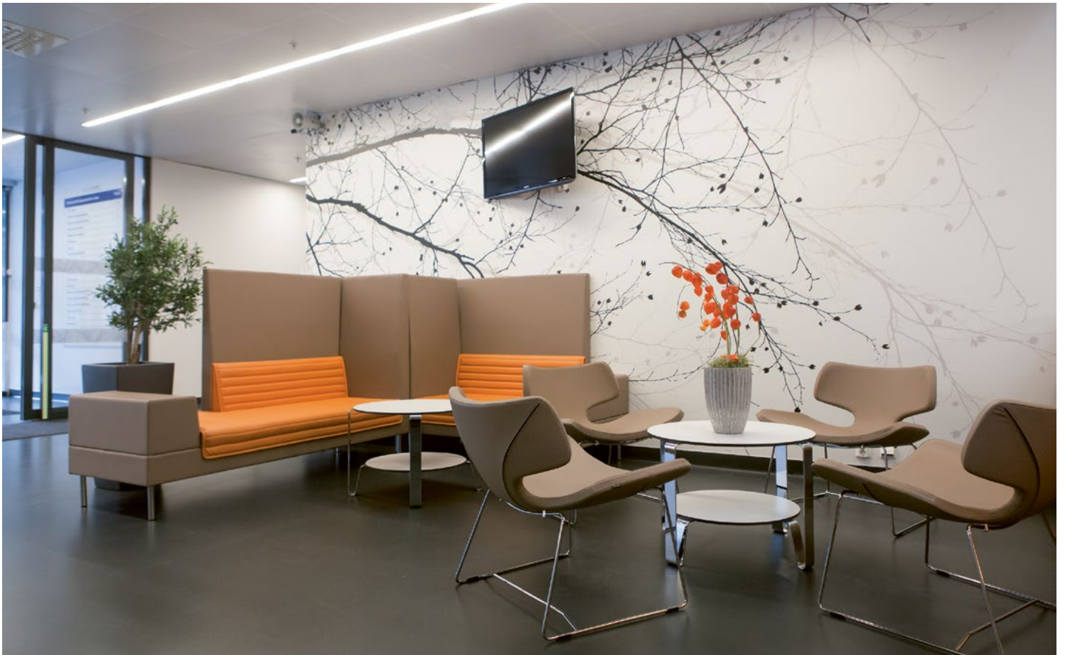
KRONSTAD DISTRIKTSPSYKIATRISK SENTER (DPS) → BERGEN → 2013 DESIGN & INNREDNING Heidi Irene Tungodden, Bodil Helvik Forsdal, interiørarkitekter MNIL