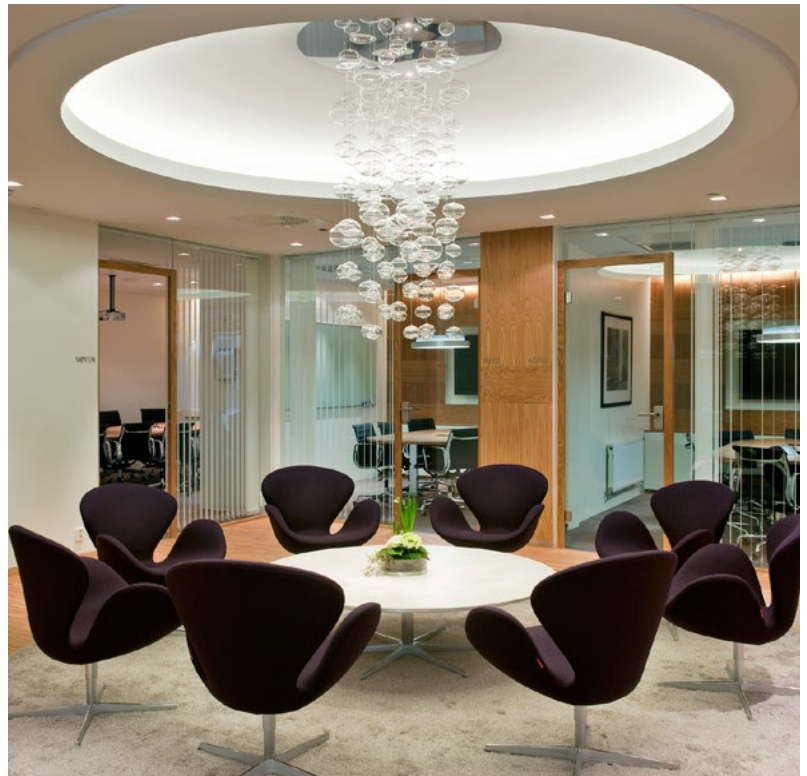
LYSAKER PARK→STOREBRAND HOVEDKONTOR→2009 LINK ARKITEKTUR AS Prosjektleder for ARK→Johan Korff Prosjektleder for IARK→Torunn Petersen, Interiørarkitekt MNIL

og Helseth sprenget noen grenser, ikke minst Osterhaug som tegnet en hytte man kan si gikk ut over det vante mandatet en interiørarkitekt har. Den aller største prestasjonen er imidlertid ikke elementene – hytta og interiøret – hver for seg, men som en helhet.