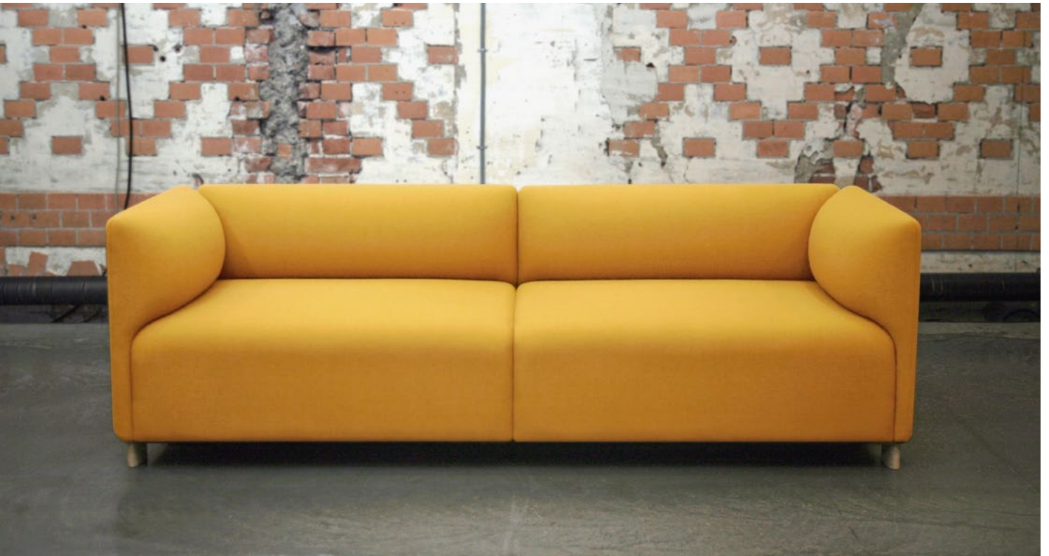
PRINS SOFA FOR MOKASSER → 2014 ATLE TVEIT DESIGN Prosjektleder → Atle Tveit, møbeldesigner MNIL